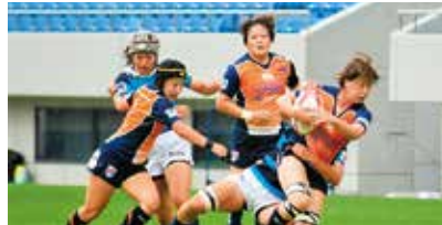
※選手の代わりにチームスタッフが参加する可能性があります。