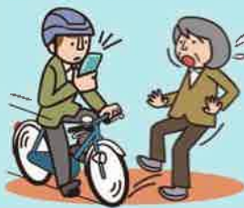
スマホ等使用運転