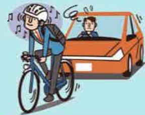
イヤホン等使用運転